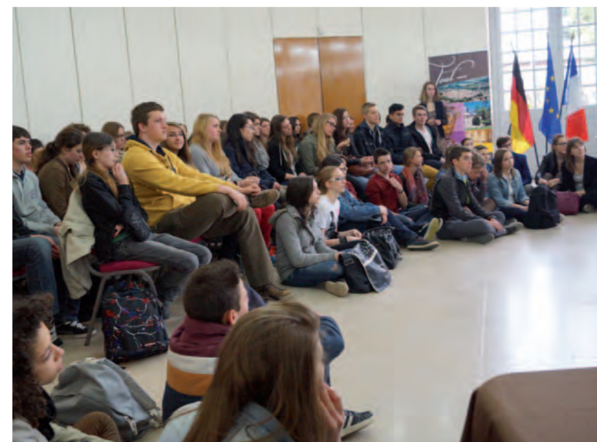
Lyceens de Hamm en visite à Toul