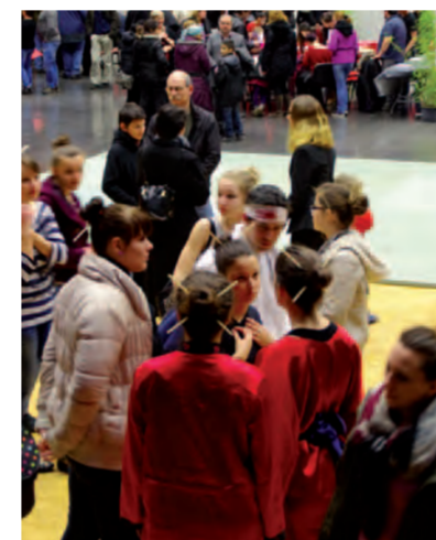
Objectif Japon, soirée de clôture