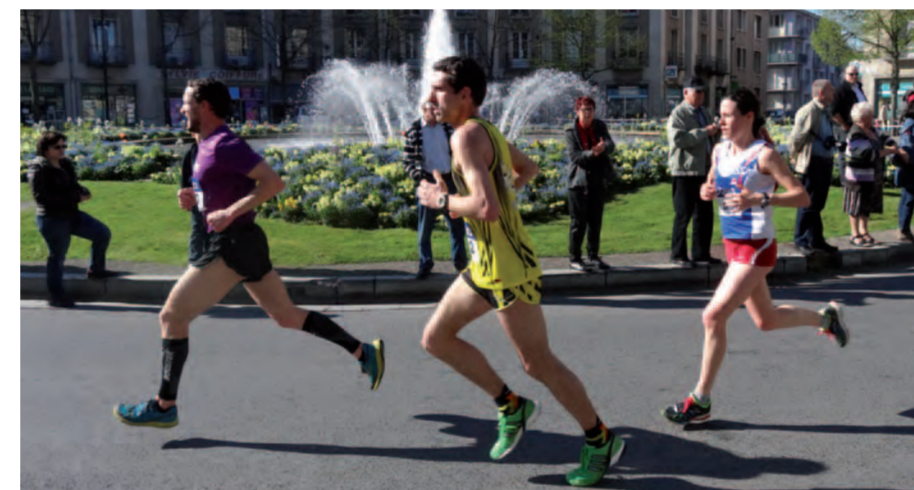
Les 10 km de Toul