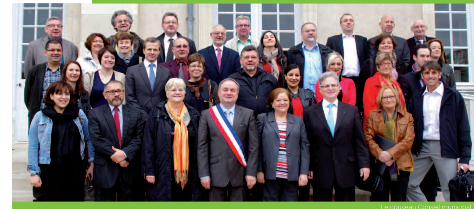
Le nouveau Conseil municipal

Découvrez le nouveau Conseil municipal !