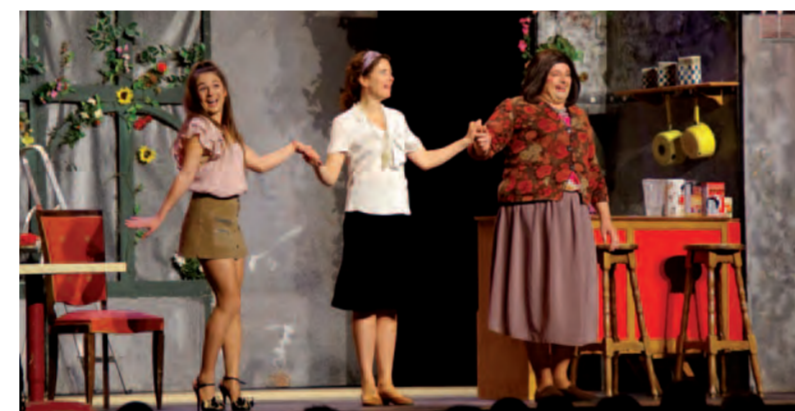
Le clan des divorcés