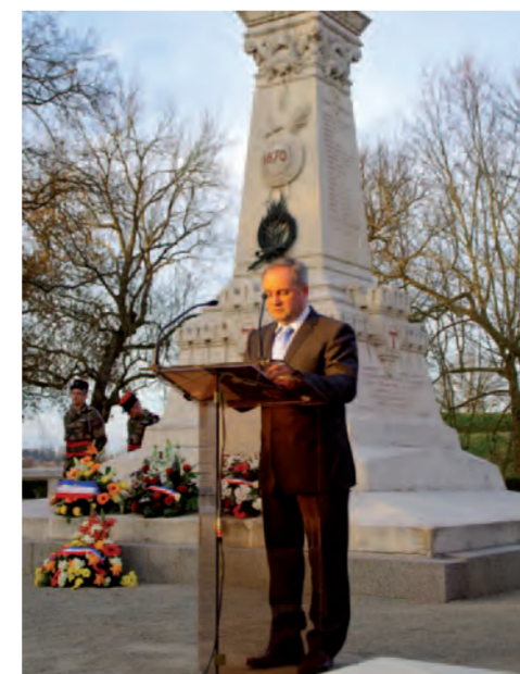
Commemoration du 19 mars 1962