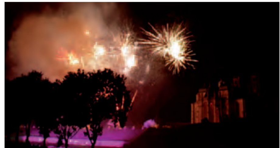
Toul Feu, Toul Flamme