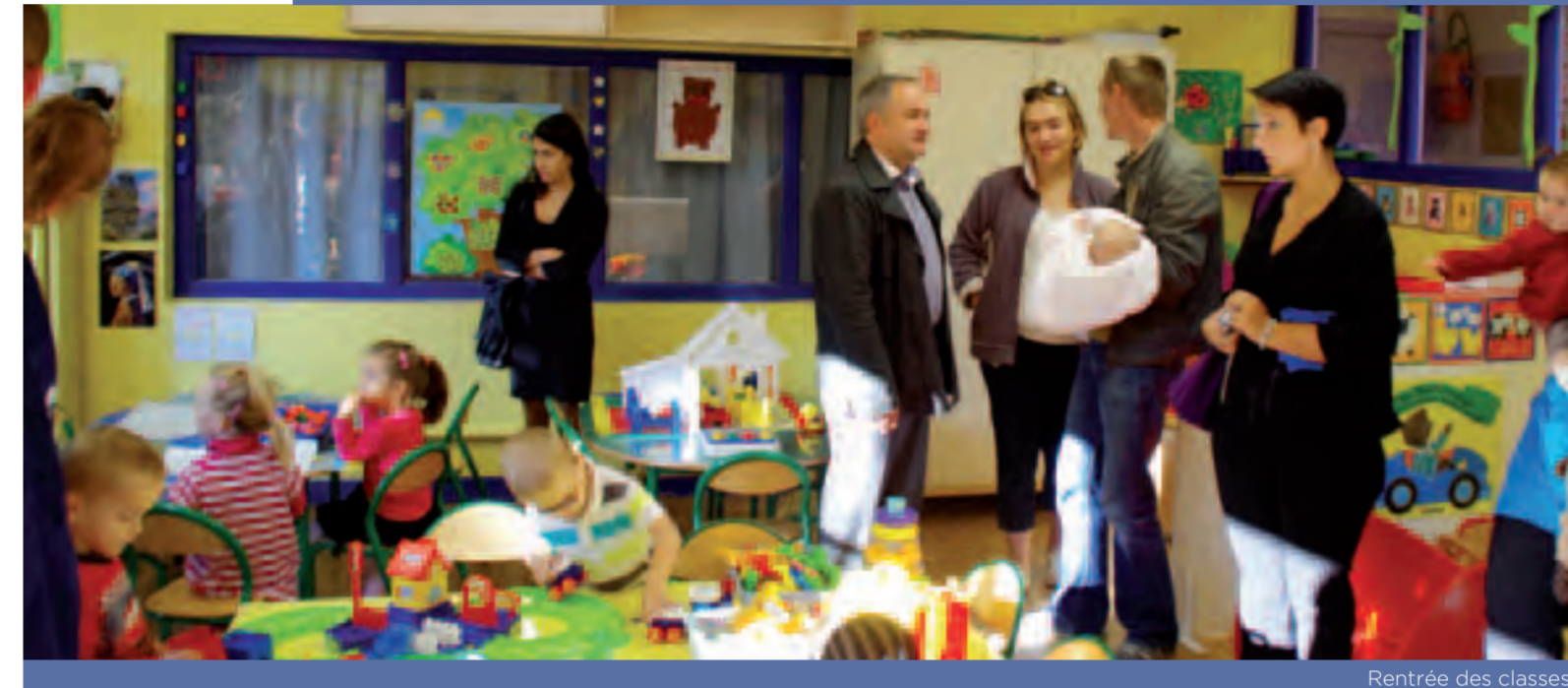
Rentrée des classes