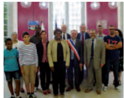
Cérémonie d'acquisition de la citoyenneté française