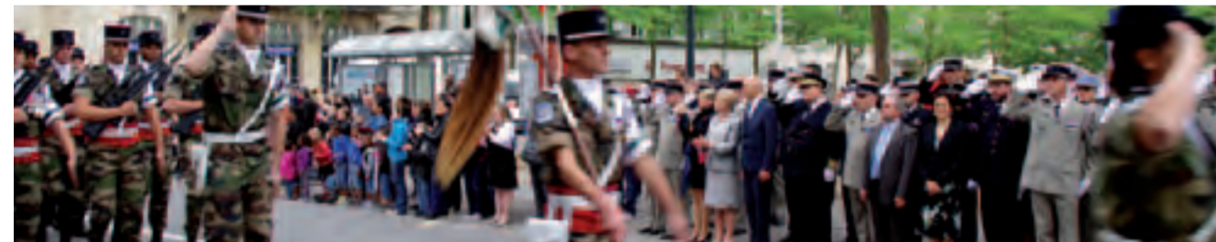
Cérémonie du 14 juillet