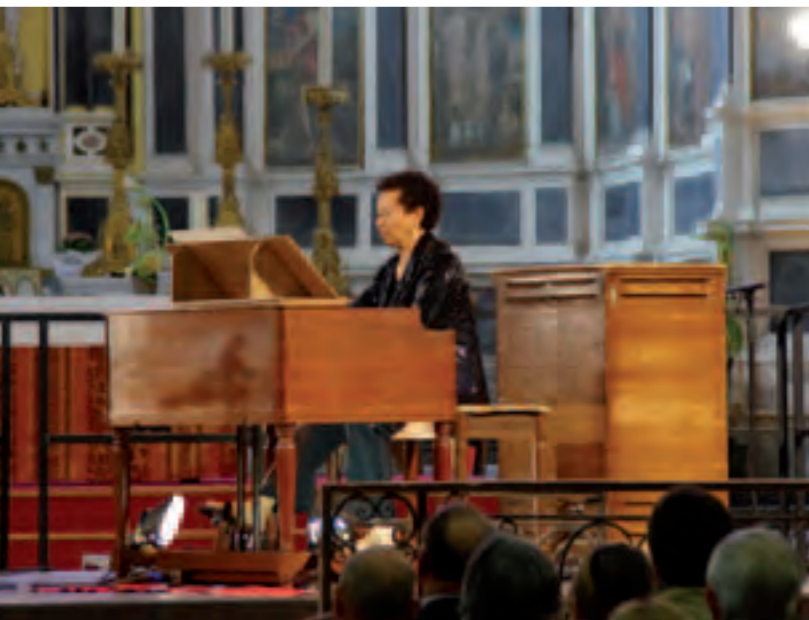
Concert Rhoda Scott