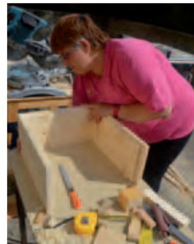
Atelier Bricol'Bois, fabrication de ruches