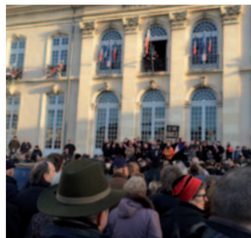
Rassemblement du 11 janvier 'Je suis Charlie'