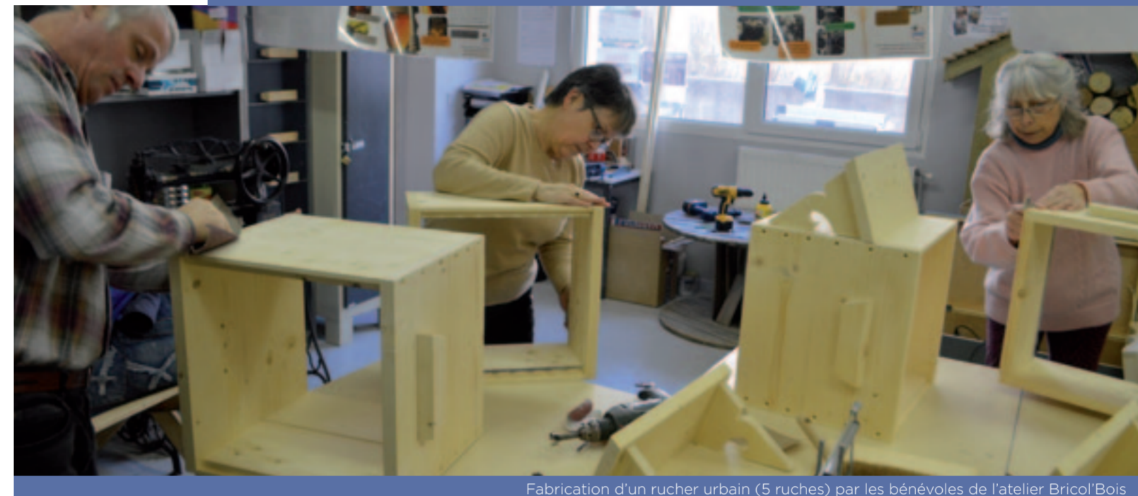
Fabrication d'un rucher urbain (5 ruches) par les bénévoles de l'atelier Bricol'Bois