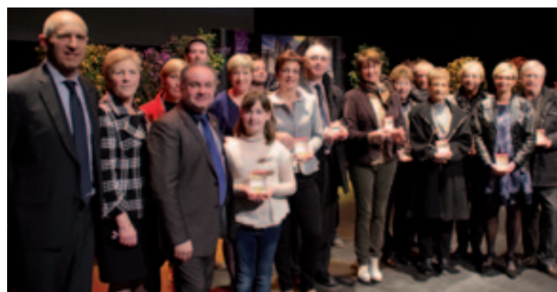
Remise de la médaille de la Ville aux acteurs locaux