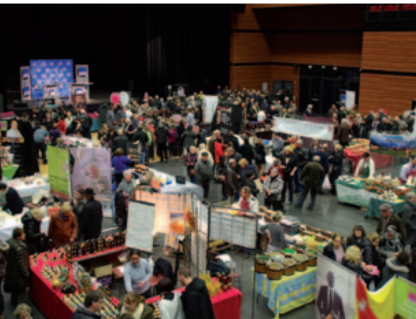
1 er Salon Lorrain de la Gastronomie