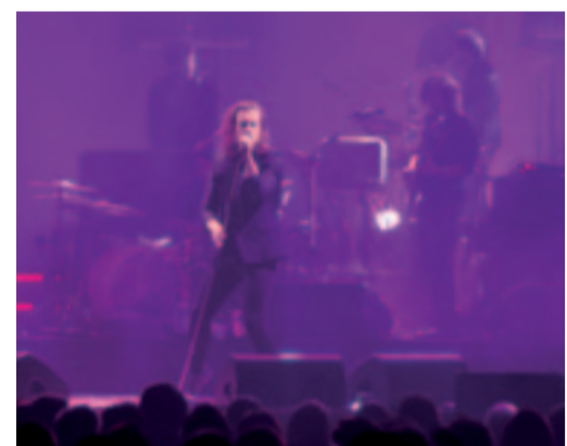
Concert Julien Dore