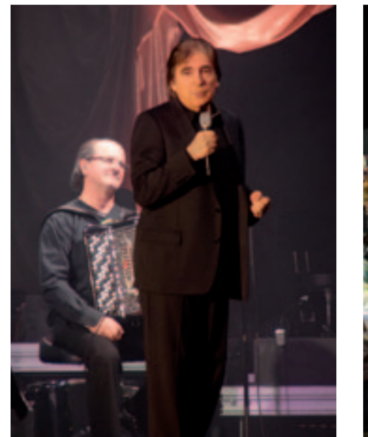
Concert Serge Lama