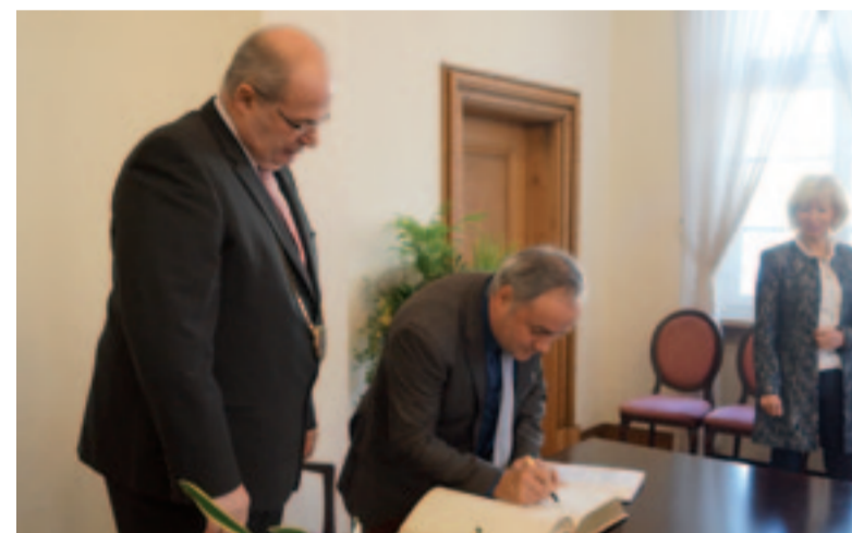
Jumelage Hamm-Mitte / Toul : signature du livre d'or de la ville de Hamm