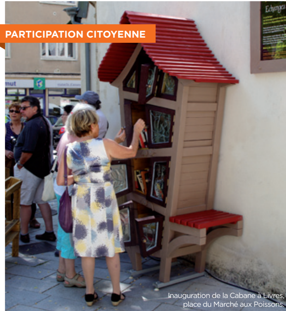
Inauguration de la Cabane à Livres, place du Marché aux Poissons.

Une rencontre conviviale autour d'une barbecue a déjà eu lieu en juillet pour inaugurer ce nouveau terrain à l'avenir prometteur !