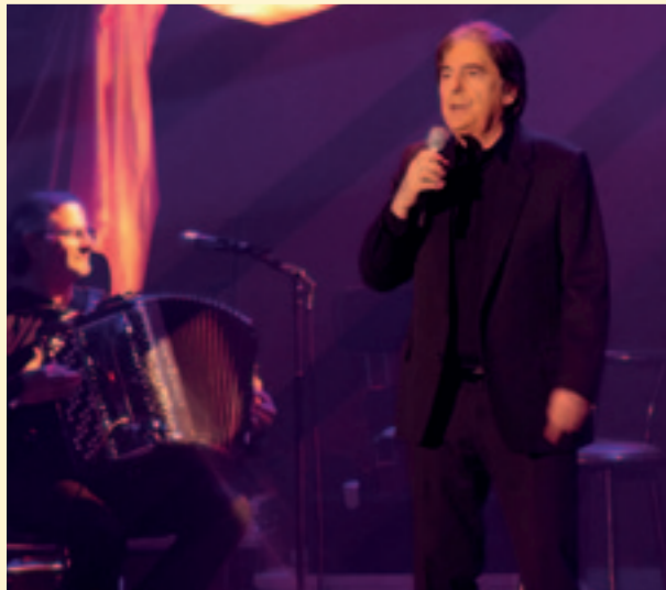
Plus de 700 fans ont applaudi Serge Lama sur scène le 17 janvier