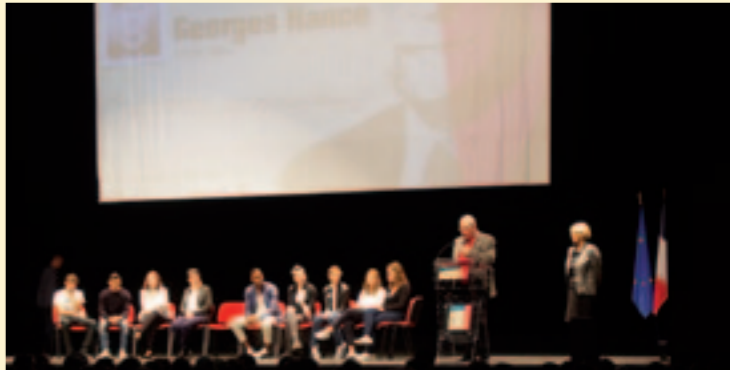
Plus de 1000 lycéens réunis pour un hommage émouvant au résistant toulous Georges Hance