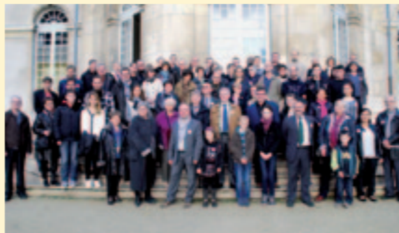
Découverte de la ville et de ses équipements au programme de la journée d'accueil des nouveaux habitants