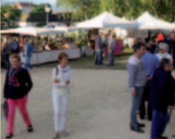
Succès incontestable pour sa première édition : la Nocturne du Port sera renouvelée l'été prochain