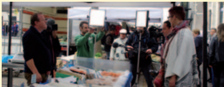
Silence, ça tourne sur le marché à Toulouse, avec l'émission "Ça roule en cuisine"