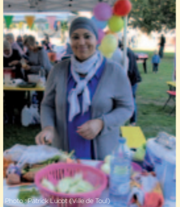
Sourires et bonne humeur au menu de la Fête de la Soupe qui a accueilli plus de 1000 gourmands !