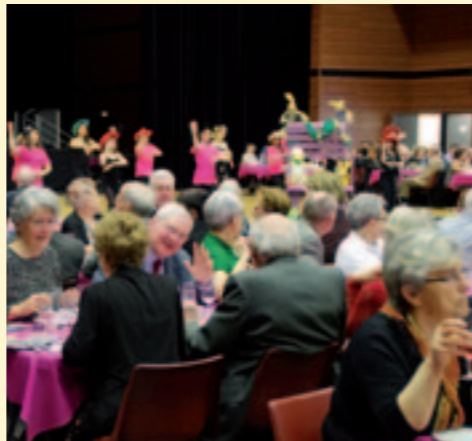
Le traditionnel repas de Pâques offert par le CCAS : un moment convivial et coloré !