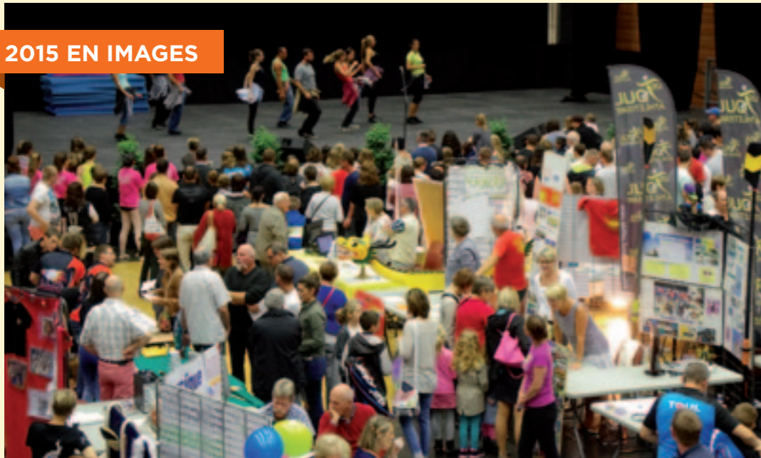
Près de 2000 Toulous ont pu choisir leurs activités lors du Forum des Associations le 5 septembre