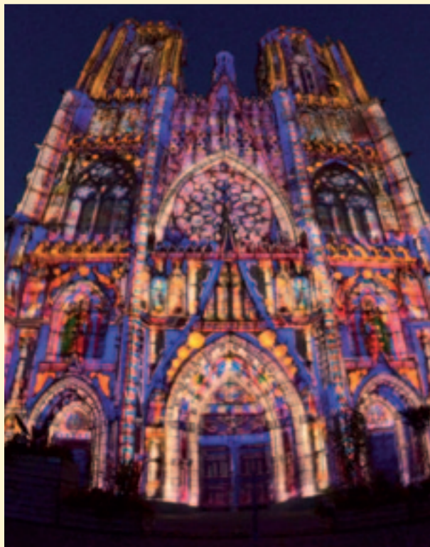
Le nouveau spectacle "Cathédrale de Lumière" a réuni plus de 20 000 spectateurs durant l'été