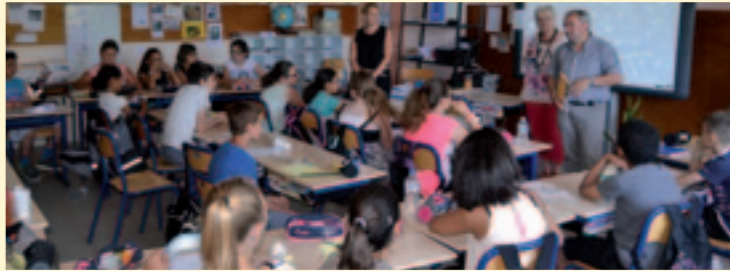
Traditionnelle remise des livres aux élèves de CM2 avec cette année un ouvrage sur l'écologie