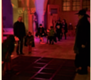
La soirée Halloween au Musée rencontre chaque année un succès grandissant, effrayant gentiment petits et grands