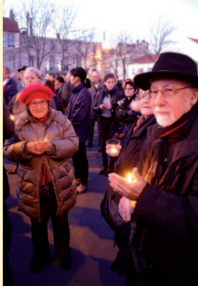
Au lendemain des attentats du 13 novembre, les Toulous réunis place de la République pour une Marseillaise vibrante d'émotion