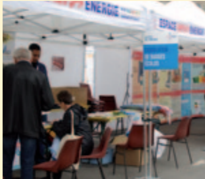
Le 10 octobre sur la Place de la République, on parlait isolation et basse consommation pour la Fête de l'Énergie