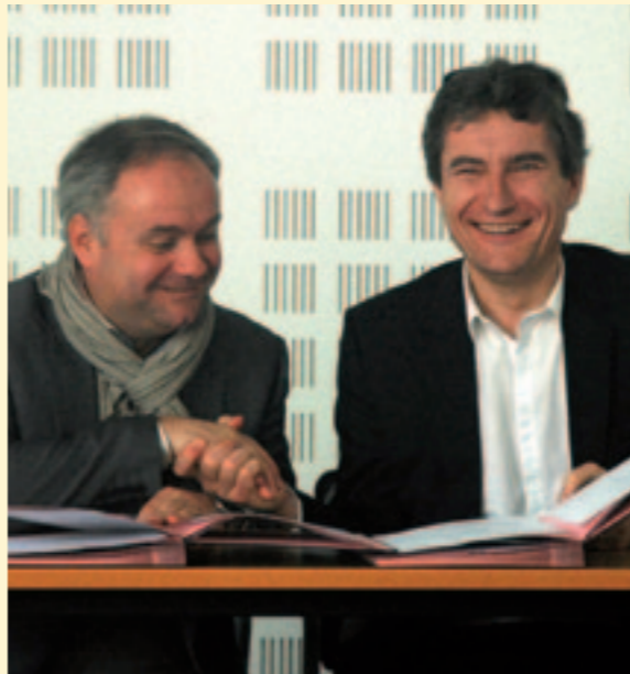
Signature de la convention avec la CCI de Meurthe-et-Moselle pour la dynamisation du centre-ville commerçant