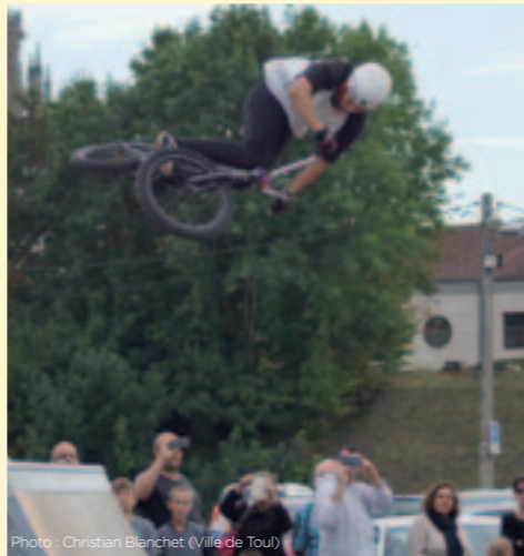
Une fois n'est pas coutume, les riders ont offert un spectacle impressionnant lors du contest de BMX, sur un skate park rénové et agrandi