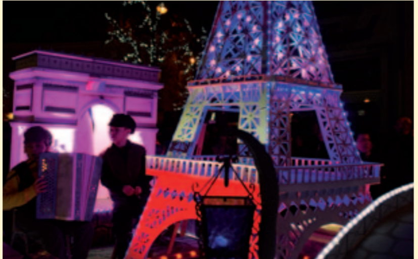
Un grand bravo aux bénévoles dont le savoir-faire a émerveillé petits et grands pour le défilé de la Saint-Nicolas