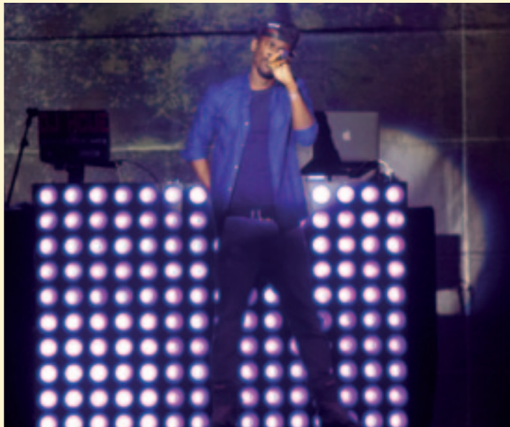
Black M a fait salle comble le 30 octobre à la Salle de l'Arsenal, avec une énergie folle !