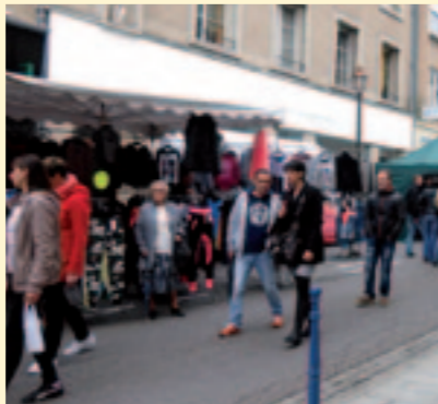
140 exposants en tout genre ont proposé de bonnes affaires aux Toulous lors de la Grande Braderie du 4 octobre