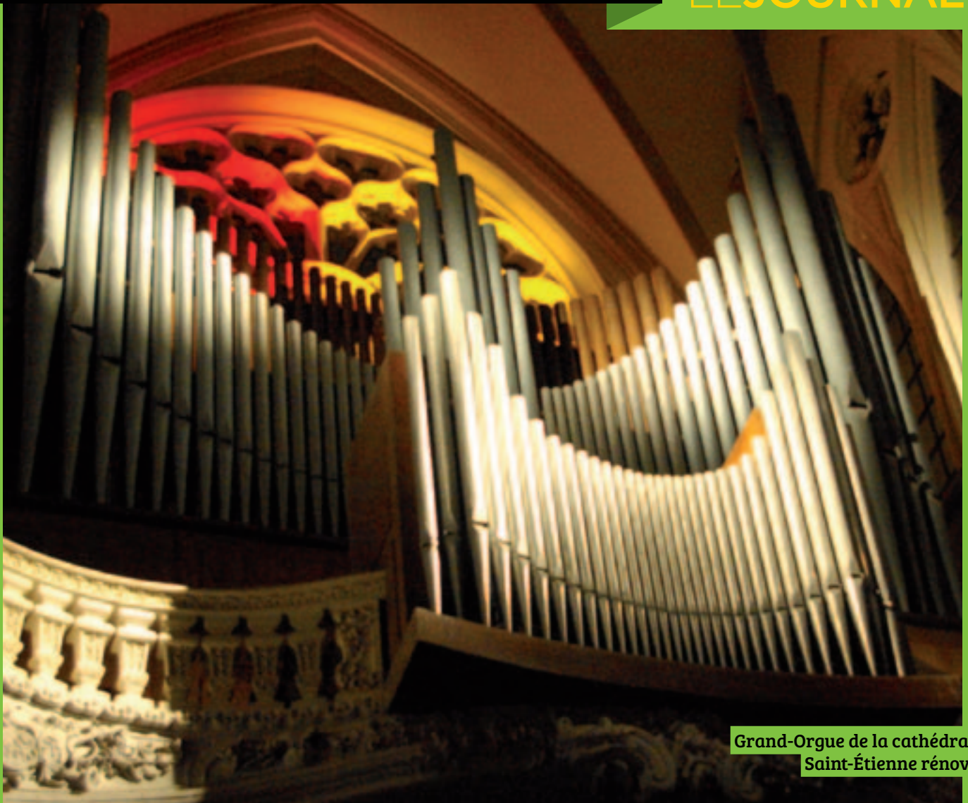
Grand-Orgue de la cathédrale Saint-Étienne rénové.