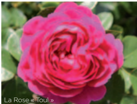
La Rose « Toul »

Roseraie André Legrand - Jardin René Laurent - Parc de l'Hôtel de Ville