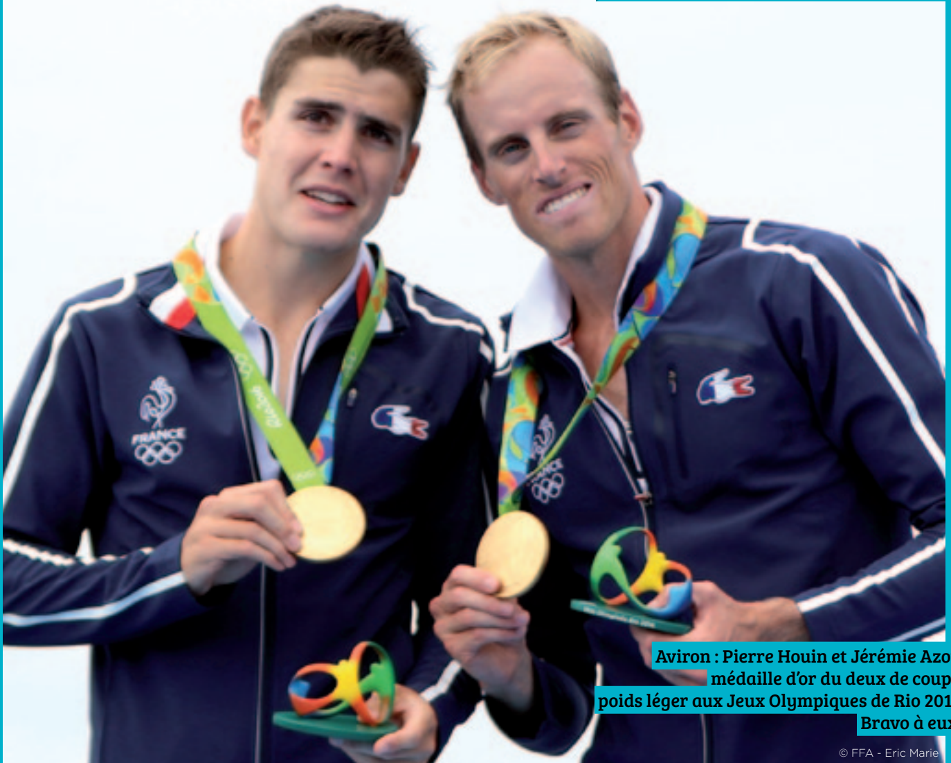
Aviron : Pierre Houin et Jérémie Azou, médaille d'or du deux de couple poids léger aux Jeux Olympiques de Rio 2016. Bravo à eux !