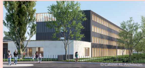
Un nouveau collège pour le quartier Croix-de-Metz