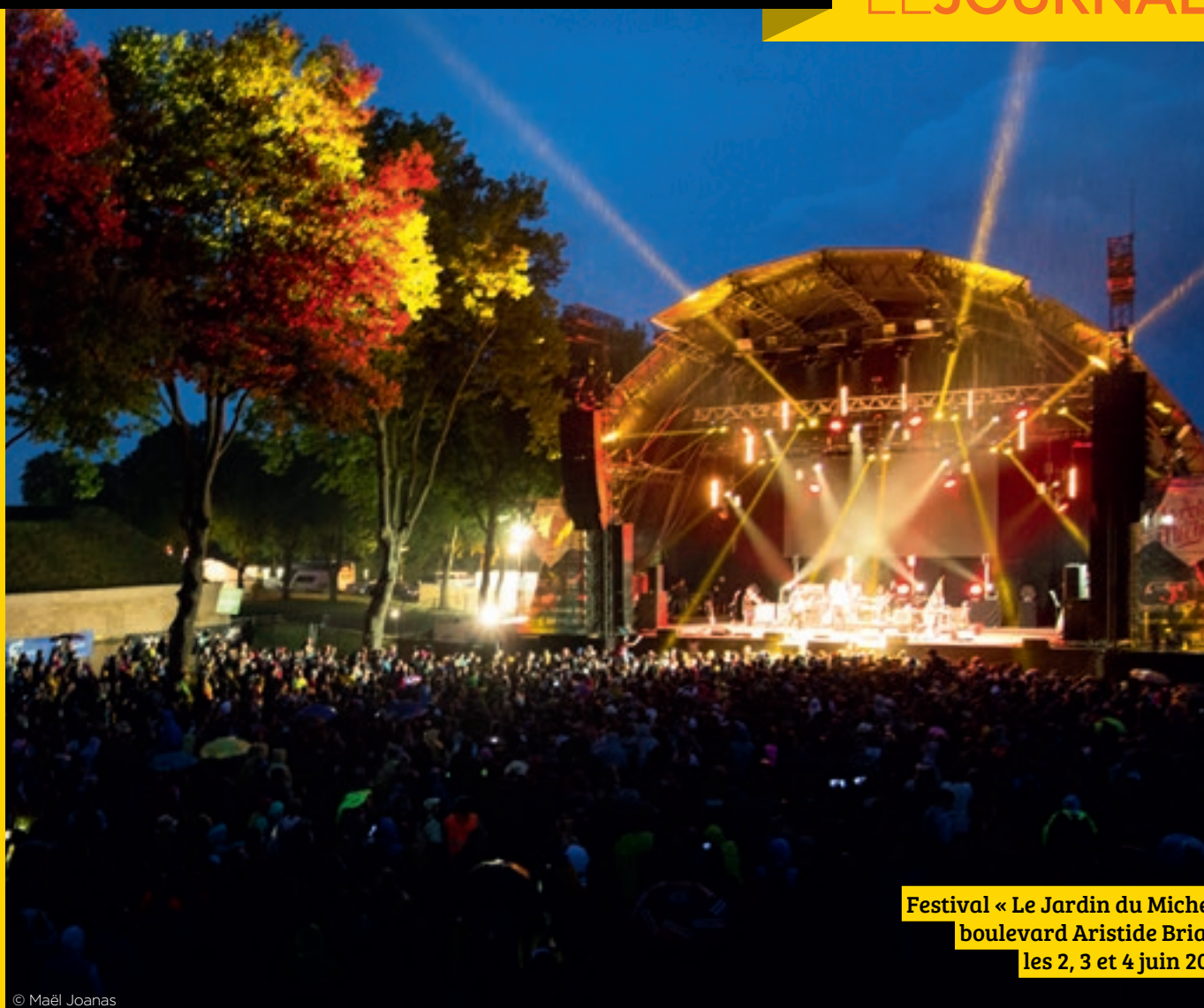
Festival « Le Jardin du Michel » boulevard Aristide Briand les 2, 3 et 4 juin 2017.