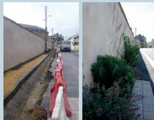
Enfouissement des réseaux rue Qui Qu'en Grogne

• 2017 : rues Qui qu'en grogne et Gouvion Saint-Cyr