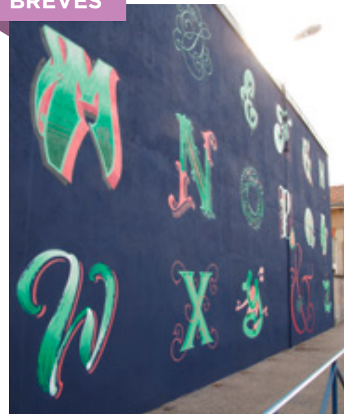
3 ème fresque du Parcours Sur les Murs - Rodes École Saint-Evre